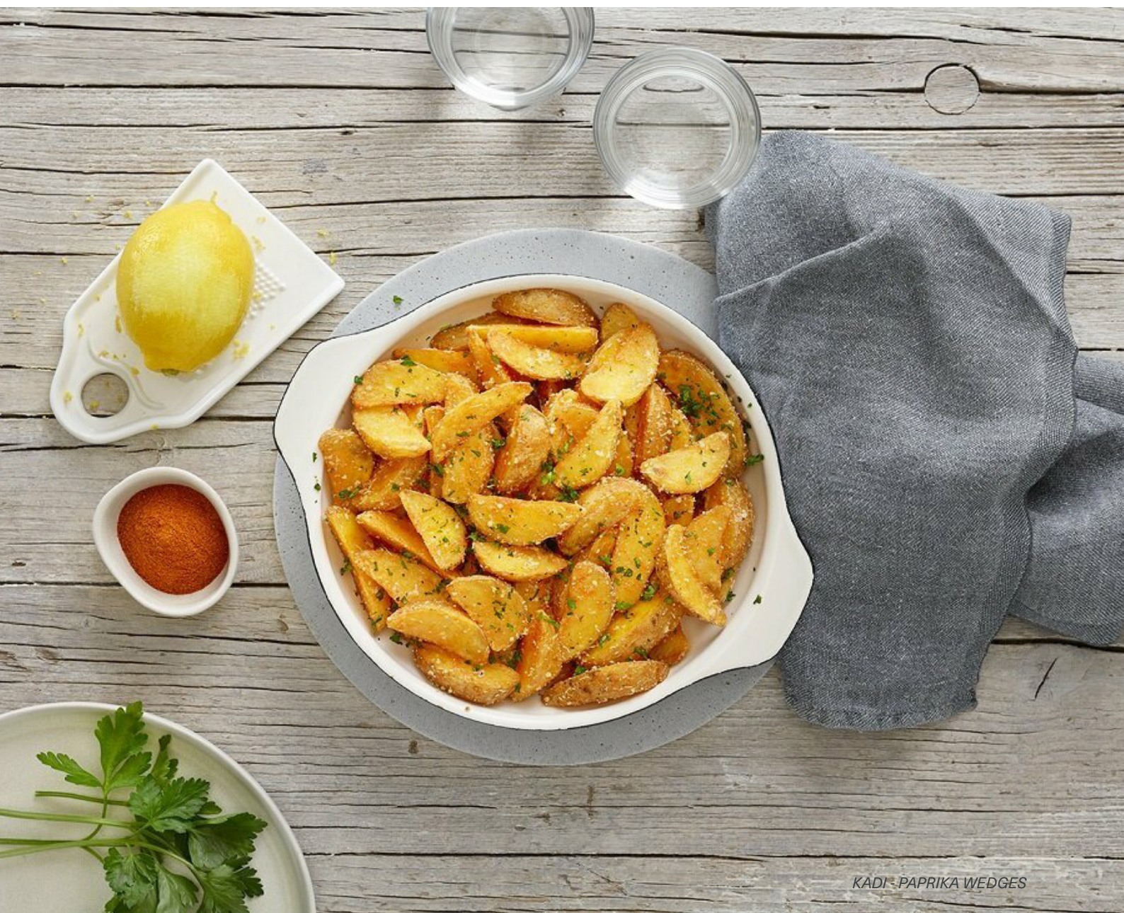
KADI - PAPRIKA WEDGES

Um diesen Qualitätsanspruch auch in Zukunft konsequent zu sichern, setzt KADI auf die Low-Code-Plattform engomo – als Schlüssel zur kontinuierlichen Digitalisierung und Optimierung der Prozesse und Abläufe in Fertigung und Lager.